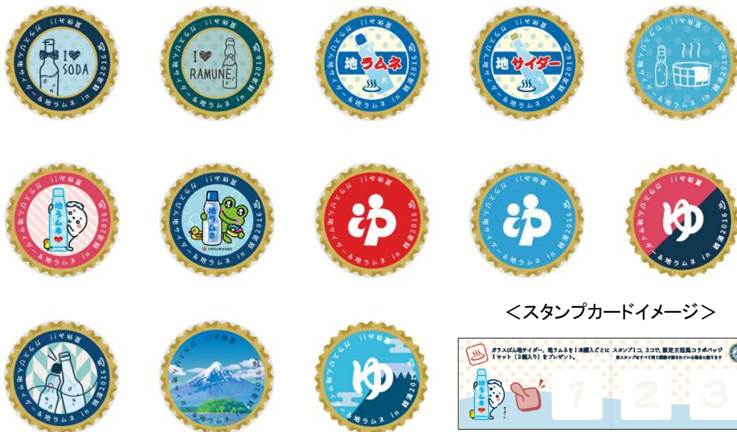
<スタンプカードイメージ>

開催期間中、「ガラスびん入り地サイダー&地ラムネ」を1本ご購入ごとにスタンプを1個、スタンプ3個で限定王冠風コラボバッジ1セット(2個入り)をプレゼントします。コラボバッジは、ガラスびんの象徴ともいえる王冠をモチーフに「ガラスびん」、「地サイダー&地ラムネ」、「銭湯」がデザインされた13種類の缶バッジにより構成されています。東京、大阪両組合の公認キャラクターや海外のお客様にも喜ばれるような様々なデザインを用意しました。銭湯ファンには堪らないコラボバッジが完成しました。